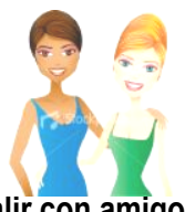
Salir con amigos