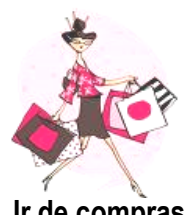
Ir de compras