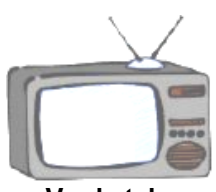
Ver la tele