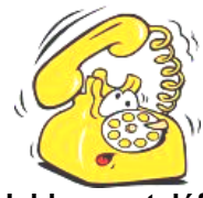
Hablar por teléfono