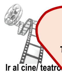
Ir al cine/ teatro